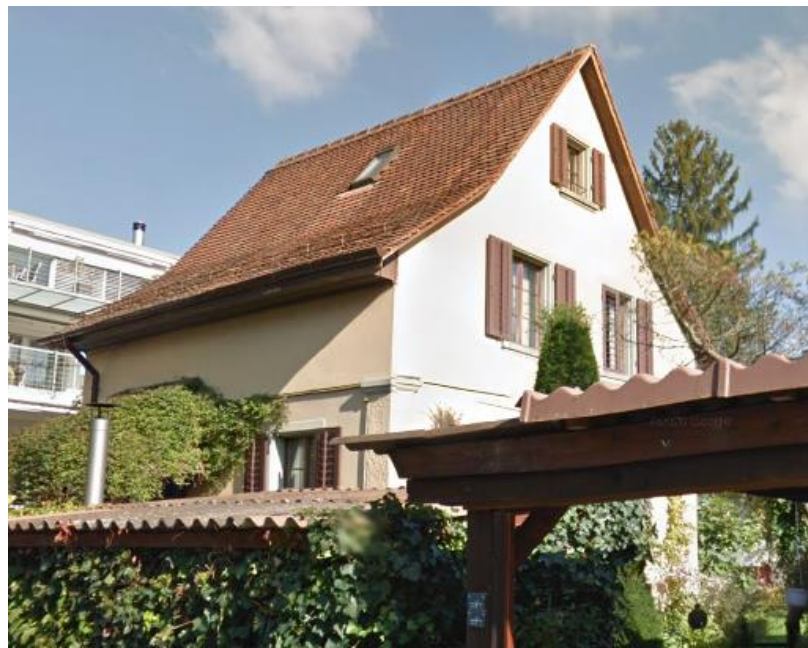
Haus Nr. 30

Riedstrasse 1, 8953 Dietikon www.bigs-zh.ch bigs@bigs-zh.ch 043 539 79 06