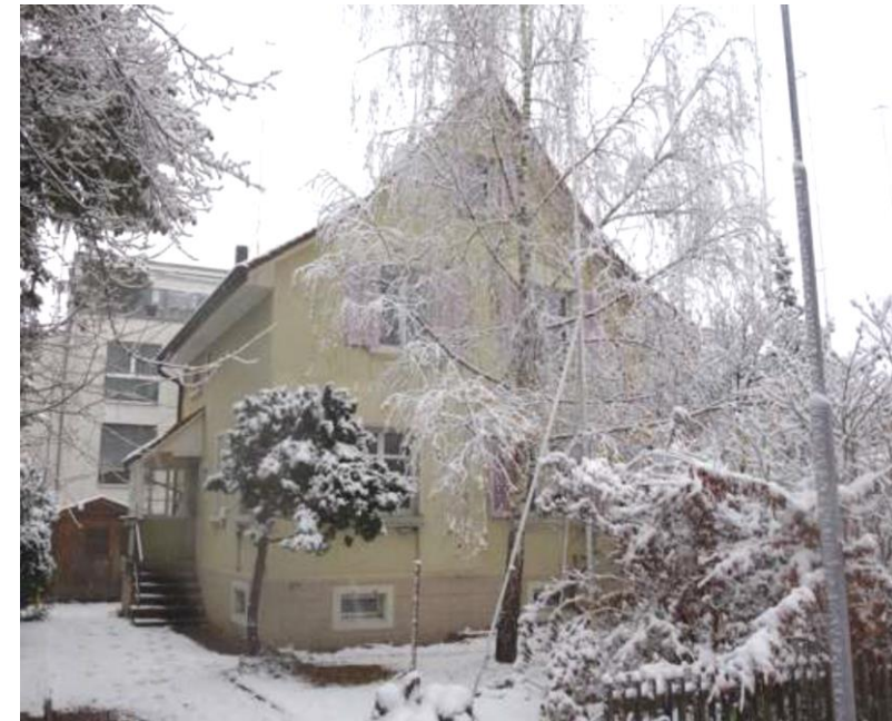
Haus Nr. 34